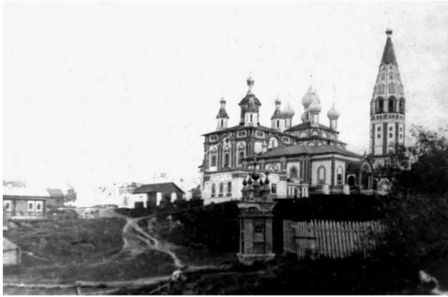
Часовня у родника. Фото нач. XX века.

«Он, угодник Божий, своим торжественным обходом видимым образом спасает местность от невидимых врагов и всяких зол и напастей» 9 . От одной часовенки к другой двигался крестный ход, освящая место проведения ярмарки. Сейчас о расположении этих культовых строений напоминают лишь старые фотографии.