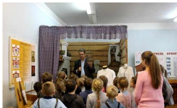
Экскурсия в школьном музее

Историю уникального рецепта Парского Калача, когда-то с давних пор был известен всем пекарям села, но со временем рецепт был практически забыт, сейчас рецепт и история Парского Калача и Парской Ярмарки хранится в краеведческом музее села открытом в местной