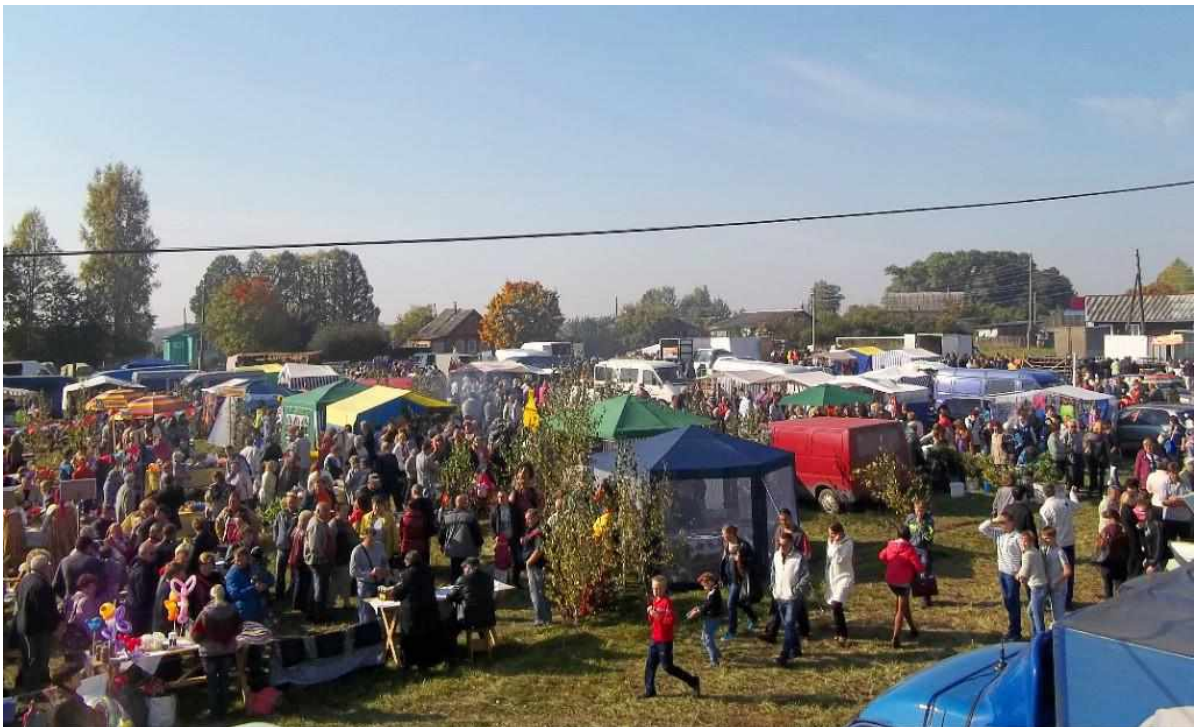
Возрожденная Парская ярмарка.