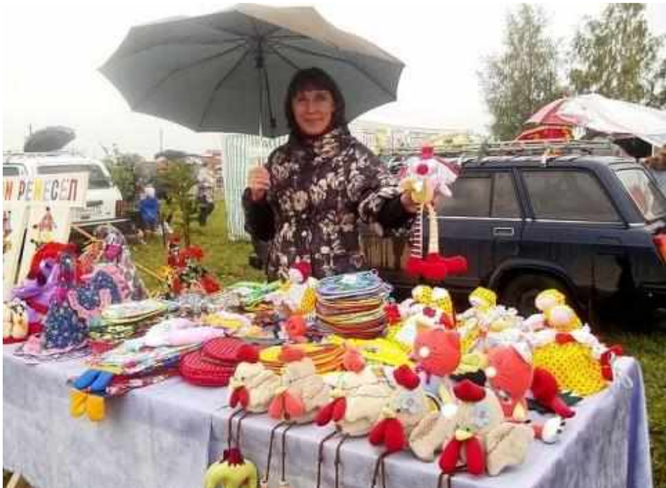
Дождь не страшен. Ярмарка состоялась. 2010 год.