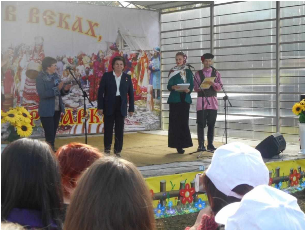
Почетный гость ярмарки 2016 года космонавт В.В.Терешкова.