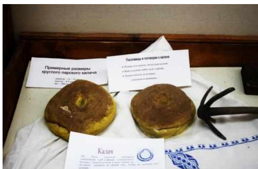
Фото из экспозиции школьного музея