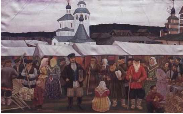
Борис Кустодиев. Сельская ярмарка.(1906 г.)

По мере того, как развивалась экономика России, помещики всё больше испытывали потребность в деньгах. Своих крестьян они переводили на денежный оброк. В восемнадцатом веке выросли и