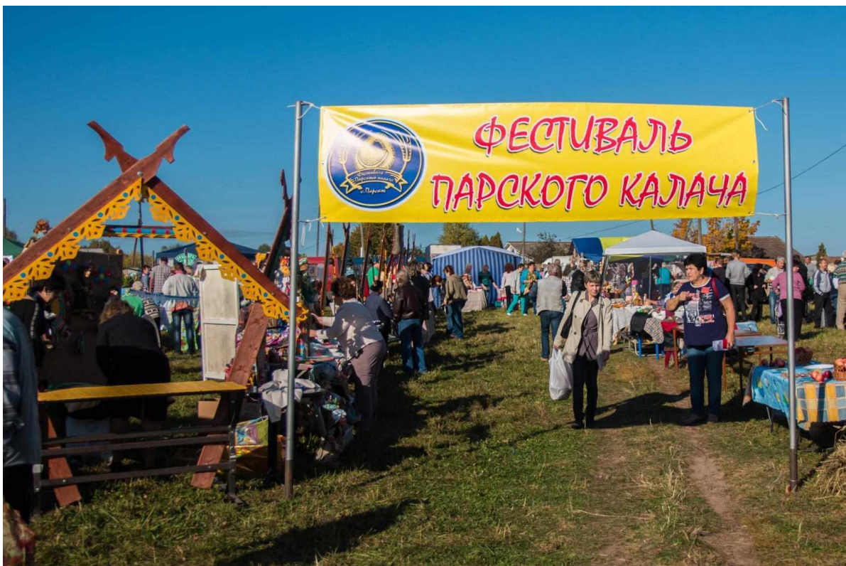
Фестиваль Парского калача. 2015-2016 гг.