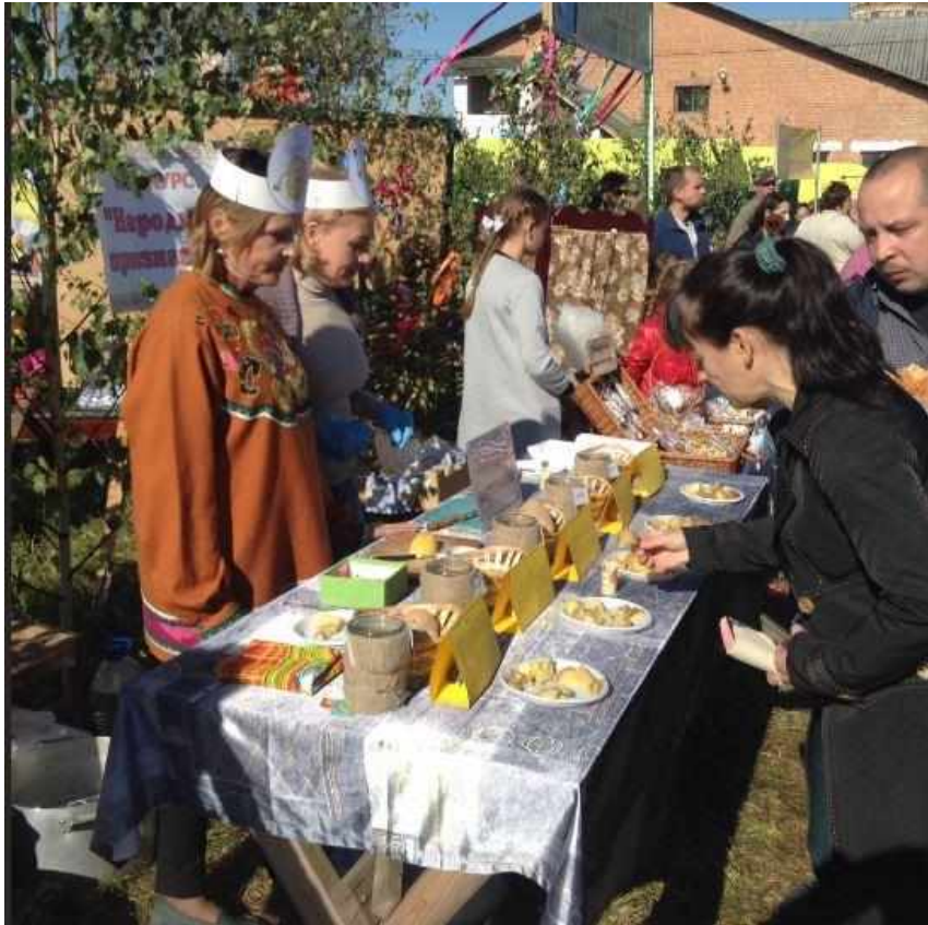
Дегустацию новых сортов картофеля проводит Родниковская публичная библиотека.. 2015 год.