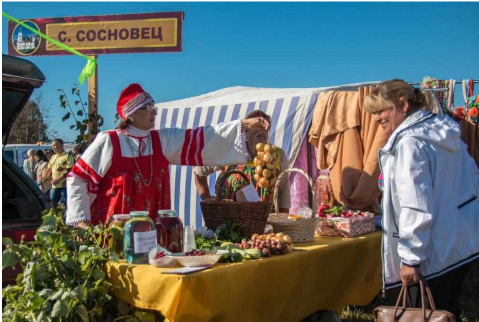
В торговых рядах сельских поселений. 2015 год.