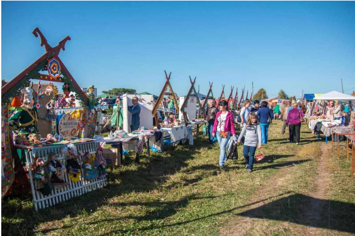
Возрожденная Парская ярмарка.