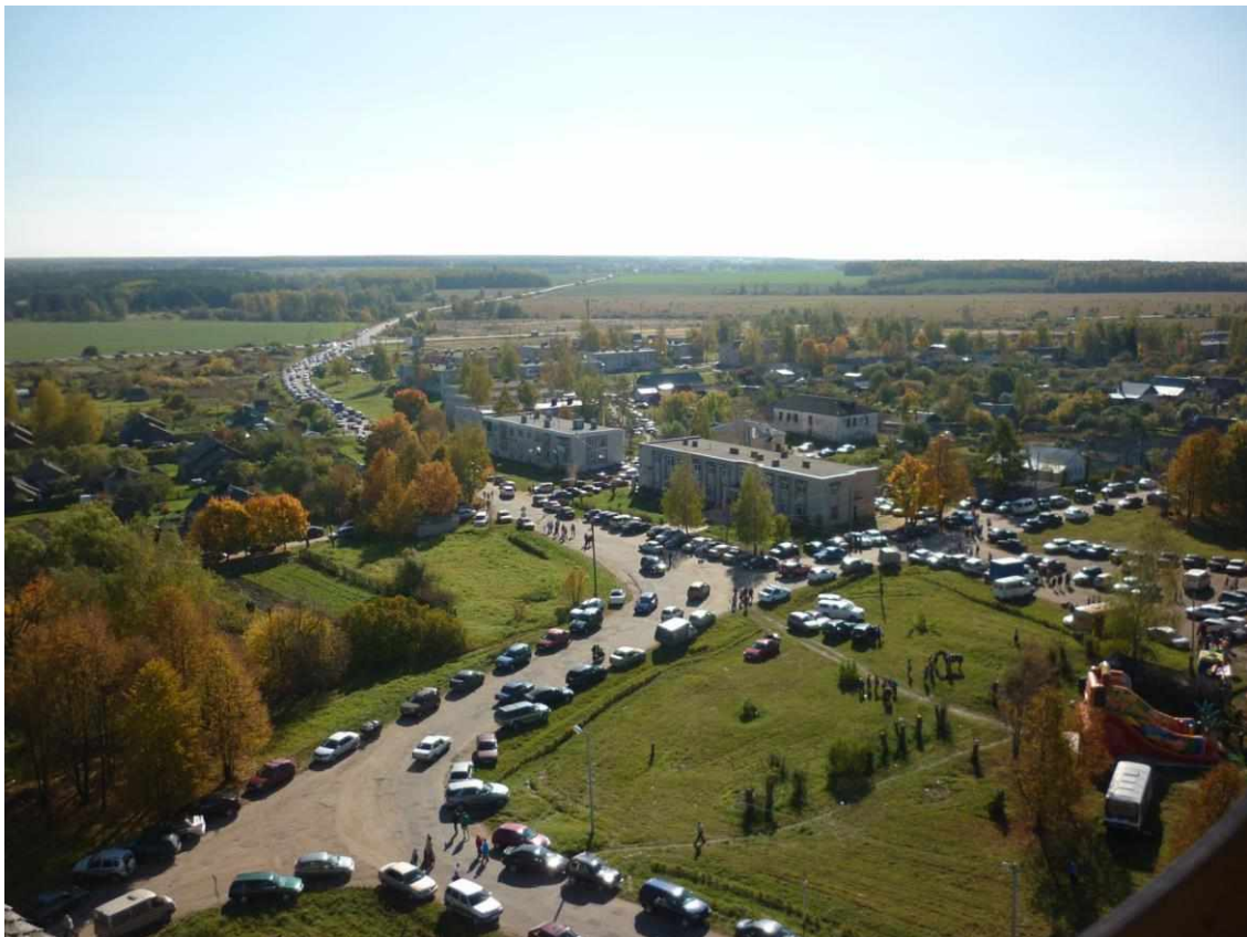
Улицы села в день ярмарки. 2018 год.