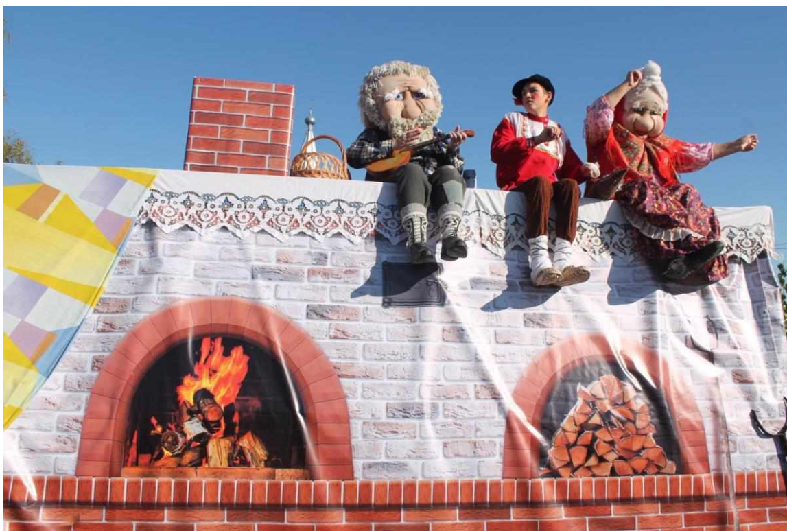
В 2017 год.