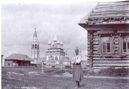
село Парское. Фото нач. XX века.

обустройству новой ярмарочной территории и строительству торговых рядов. Объём торговли на волжских берегах значительно сократился, и Парская ярмарка стала в эти годы дублёром Макарьевской.