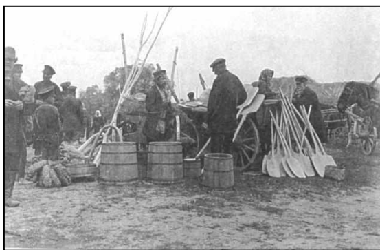
Сельская ярмарка. Фото начала XX века.

В 1921 году Советское правительство отказалось от политики военного коммунизма. Частная торговля вновь была разрешена. На промышленных предприятиях уравнильное карточное распределение заменили денежной