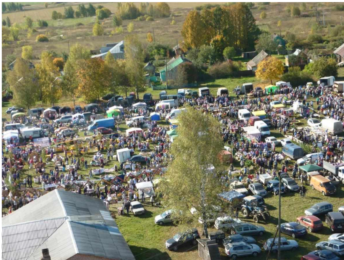
Парская ярмарка с высоты птичьего полета. 2018 год.