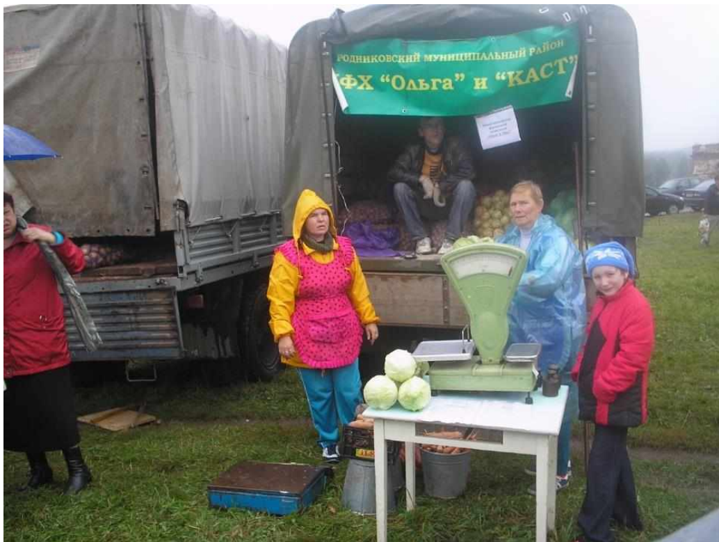
Продажа овощей и картофеля из фермерских хозяйств «Ольга» и «Каст». 2010 год.