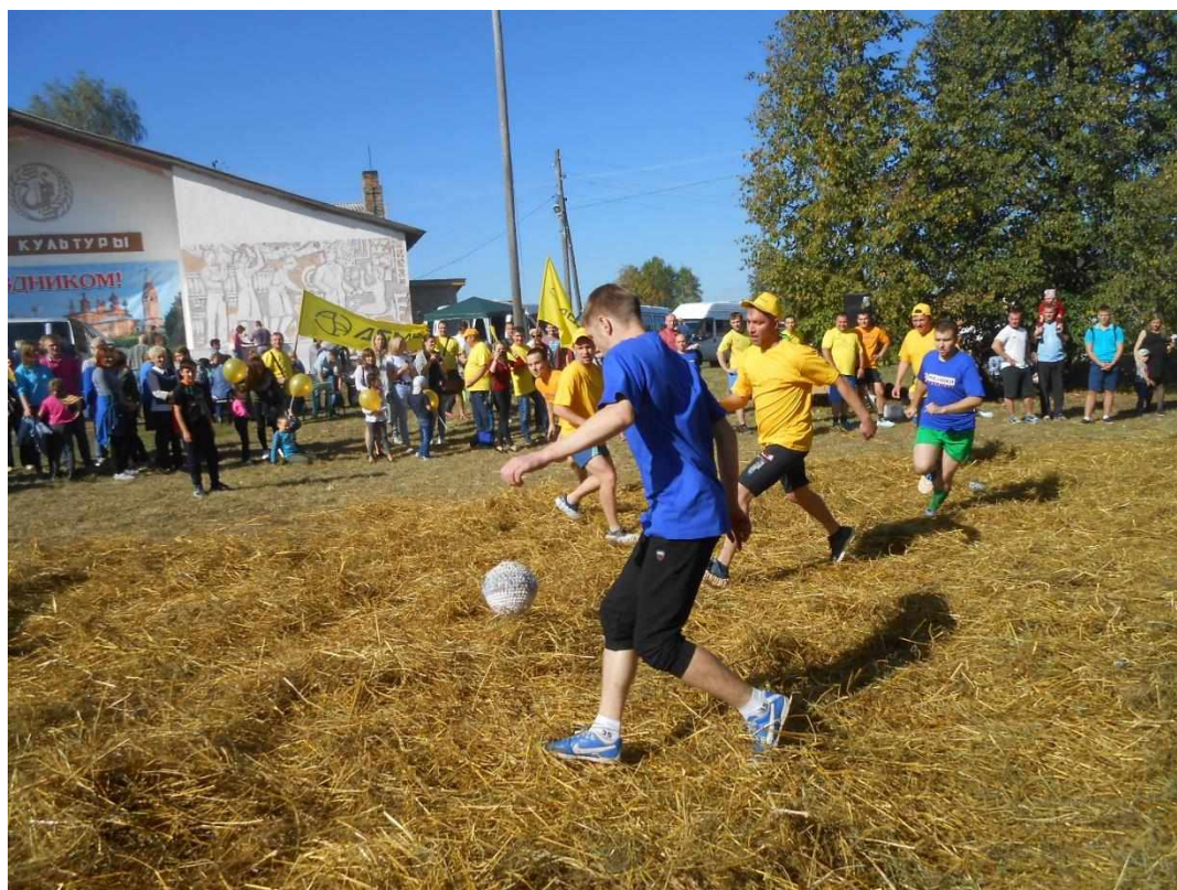
Забавы для малышей.