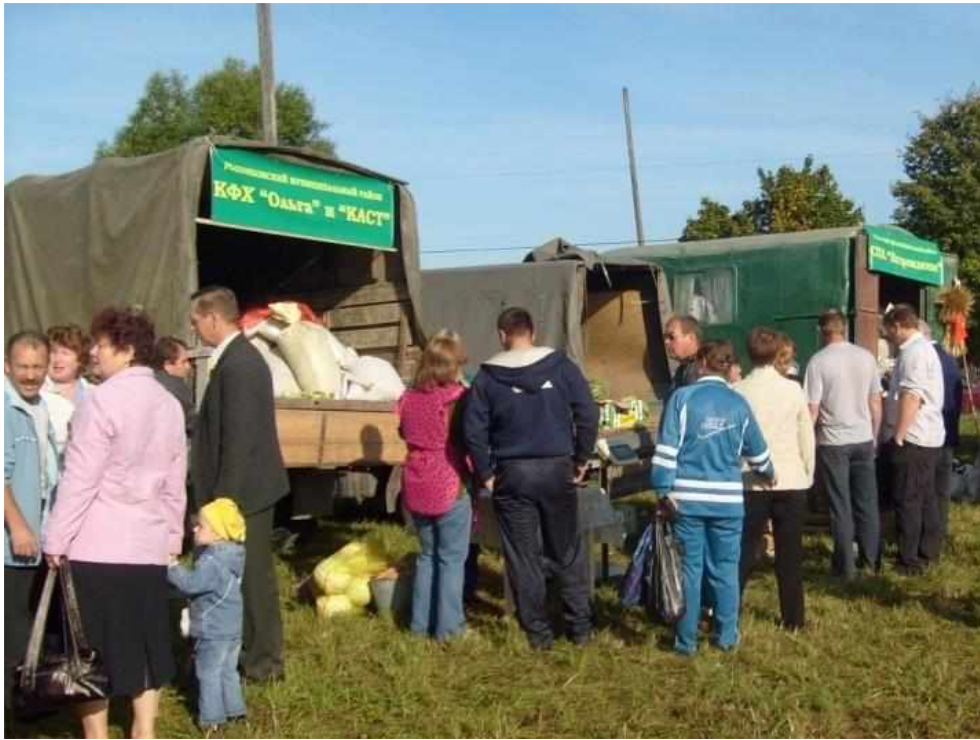
Картофель и овощи местных сельскохозяйственных предприятий – один из самых ходовых товаров ярмарки. 2009 год.