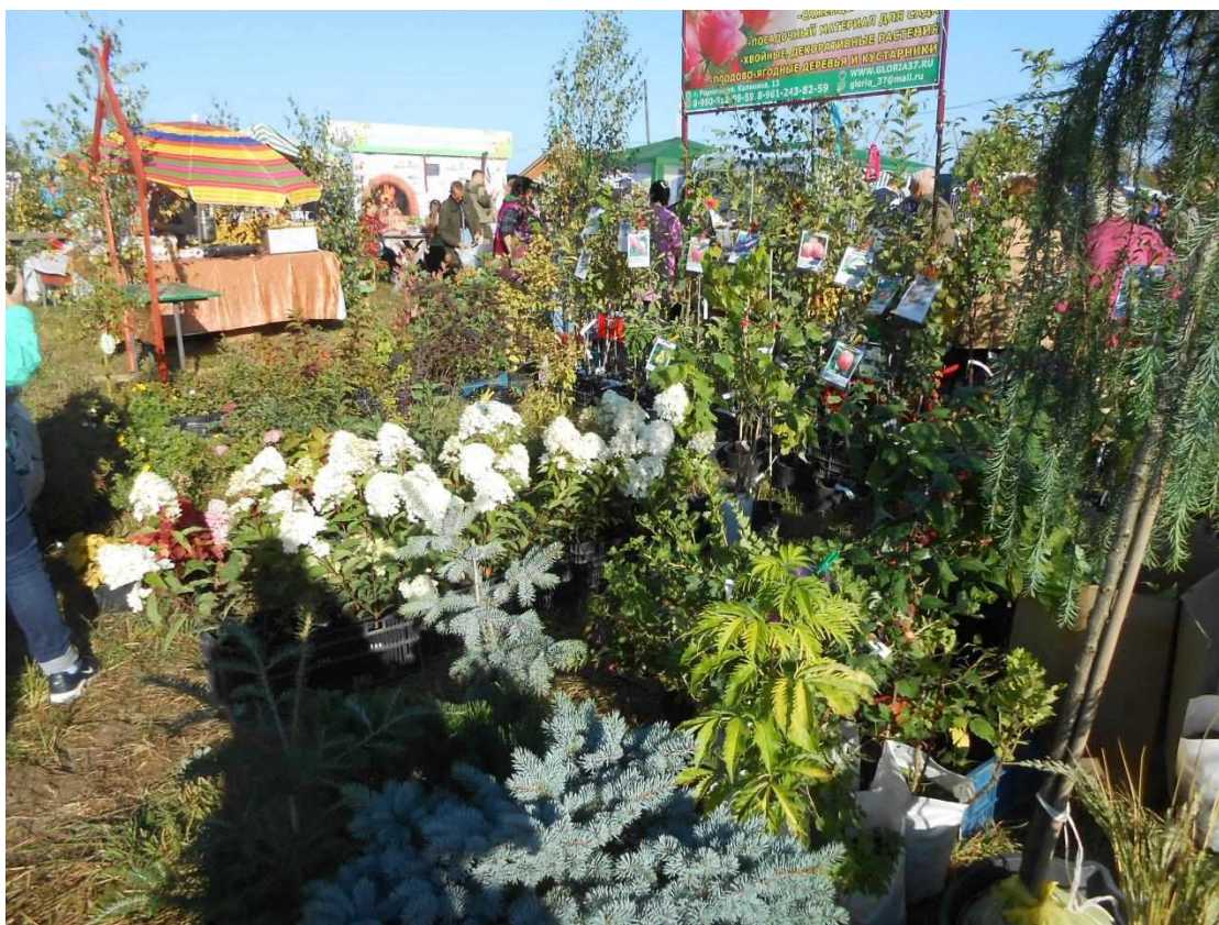
Рассада цветов и саженцы плодовых растений ежегодно пользуются большим спросом. 2018 год.