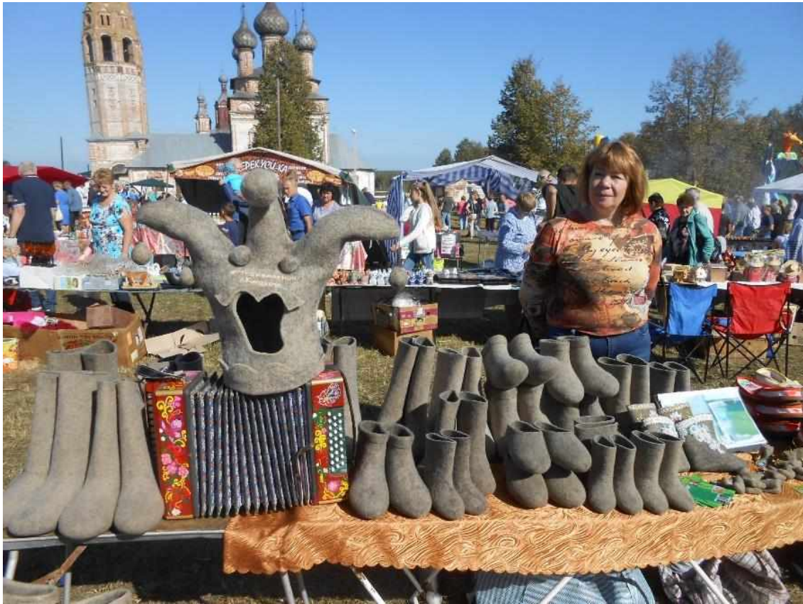
Товары народных мастеров. 2010-2018 гг.