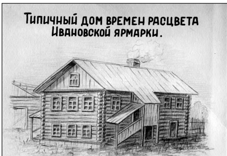
Рисунок Н.В.Шляпникова. Около 1930 г.

Учитывая, что все товары и гости прибывали на ярмарку на подводах, в селе в те дни можно было насчитать более тысячи лошадей. За поение коня его владелец должен был внести небольшую плату в пользу церкви, под опекой которой находился сам родник и прилегающая территория. Ещё одним источником дохода церкви в дни ярмарки были весы, установленные за оградой. За небольшую плату ими могли воспользоваться те, кто продавал и покупал товары целыми возами (овёс, сено и другое).