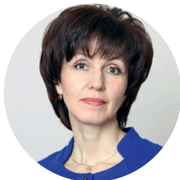
Трофимова Наталья Владимировна, член Правительства Ивановской области – директор Департамента культуры и туризма Ивановской области